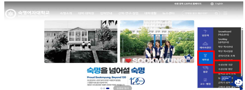
☞ 본교 홈페이지 메인화면 오른쪽, 재학생 > 수강신청 국문